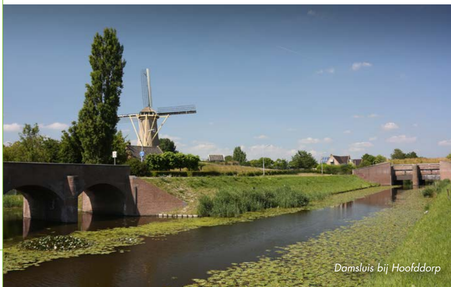
Damsluis bij Hoofddorp

'gemeenschapsweg', waarlangs de Nederlandse militairen zich ongezien konden verplaatsen. Ook de inmiddels opgeheven spoorlijn Aalsmeer-Haarlem lag achter de dijk. In 1963 werd de militaire status van het verdedigingswerk weer opgeheven. De Geniedijk heeft nog steeds een strategische ligging, maar tegenwoordig voor wandelaars, flora en fauna. Het is bijvoorbeeld een belangrijke trekroute voor vlinders en vleermuizen.